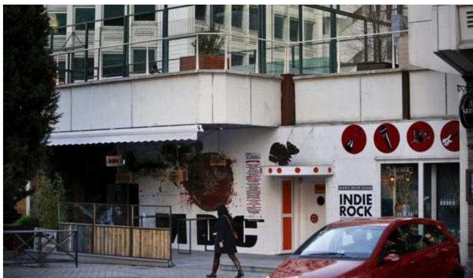
Imagen de los bares de la Avenida de Brasil, una zona de oficinas.